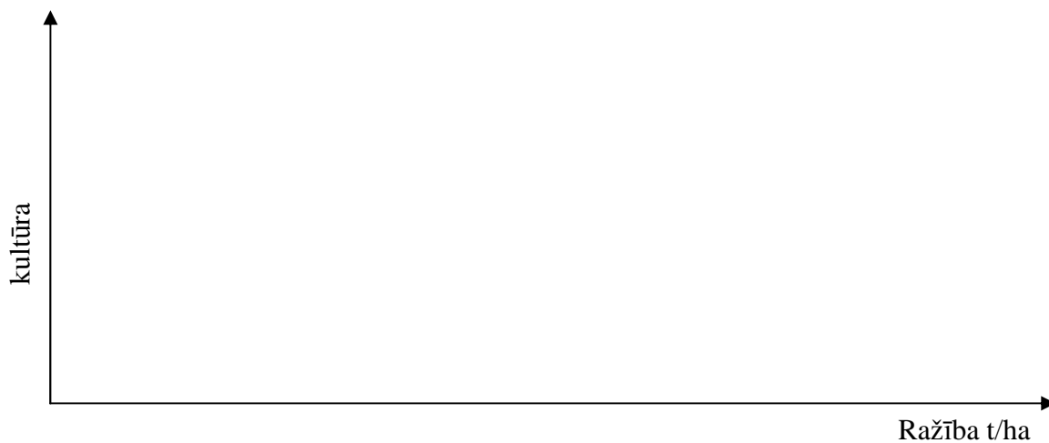
1. attēls. Kultūraugu ražība