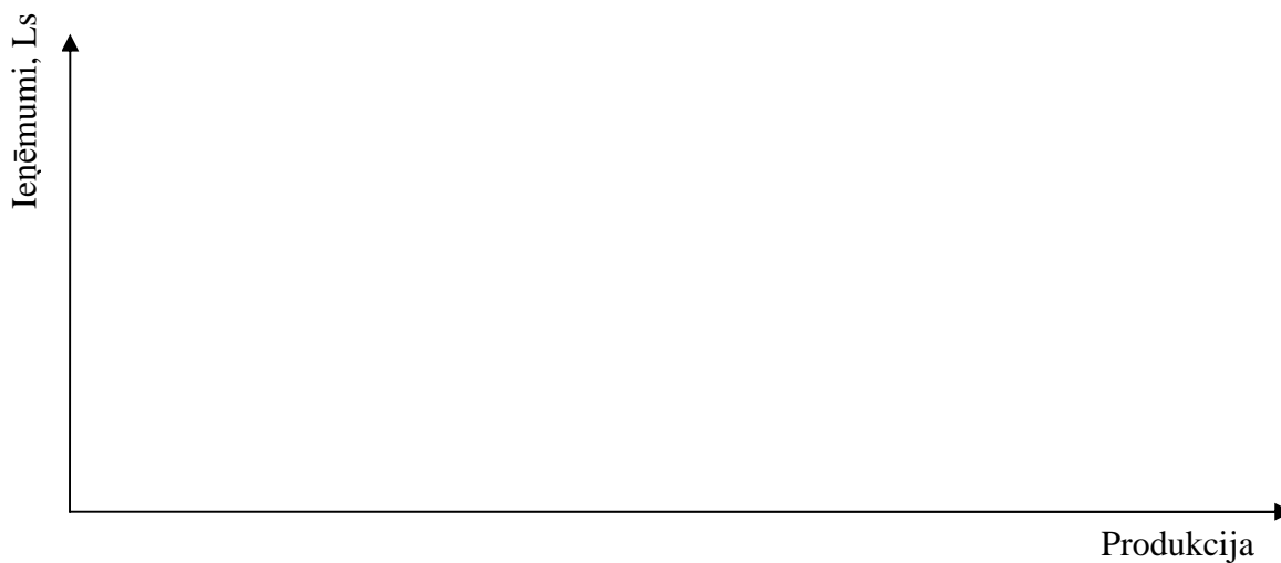
2. attēls. Saimniecību ieņēmumi no produkcijas realizācijas